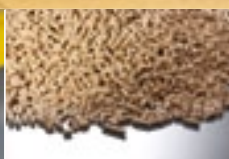
Pellets & Briketts