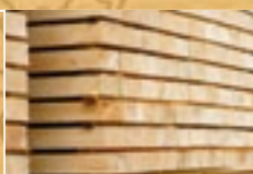
Schmittholz & Hobelware